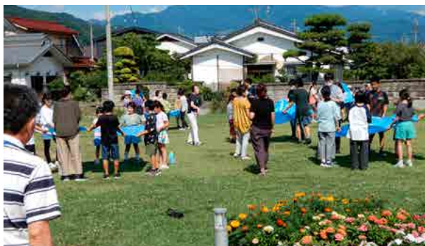
遊びの会：シートに水を入れて「イチ・ニノ・サーン」