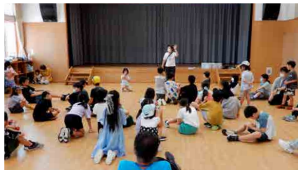
楽しかった一日の学習会も最後 《終わりの会》