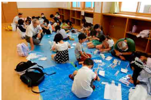
午後は物作りに挑戦です