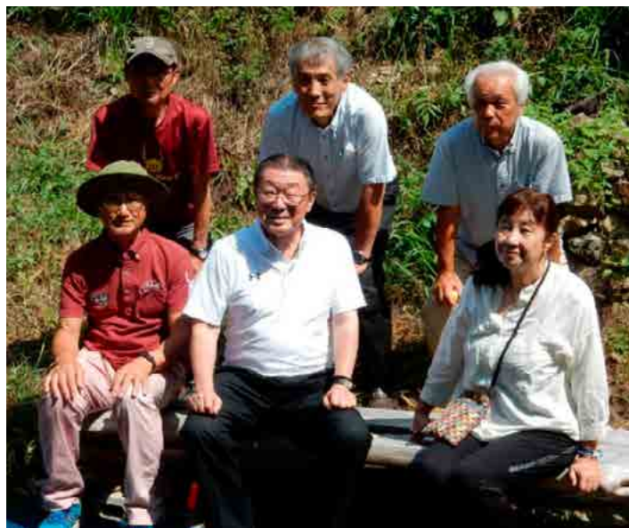
市長サテライト室：花いっぱい会の現地視察