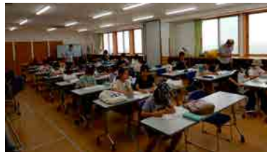
宿題を持ち寄っての学習会