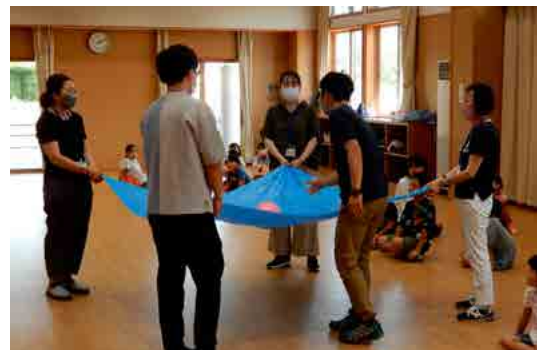
みんなでボール上げ、見本の試技