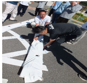
組立には大勢の力が 必要でした