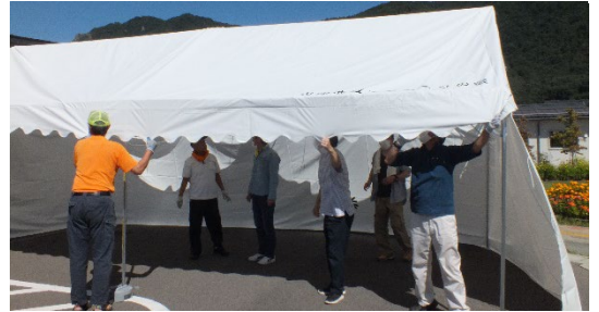
下部を立ち上げる