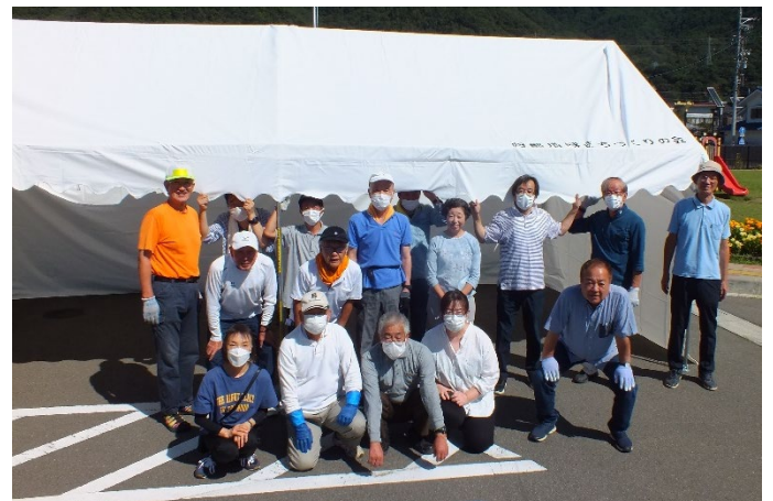
設営（組立）訓練の参加者