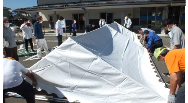
上段部分に天幕をかける