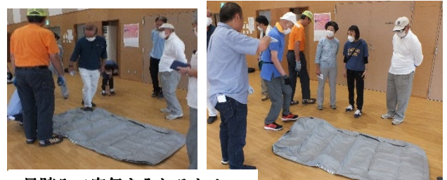
足踏みで空気を入れるため 時間がかかって大変でした