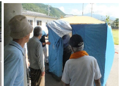
授乳室にもなるプライバシーが守られるテント