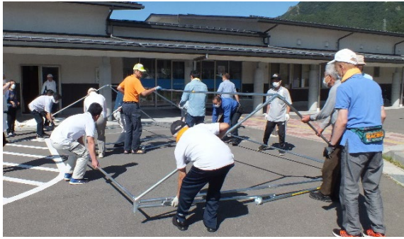
上段部分の骨組み