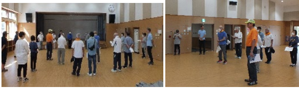
＜ 開 会 式 ＞