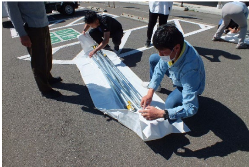
移動は袋に包んで