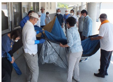
真ん中の紐を 引っ張ると開く