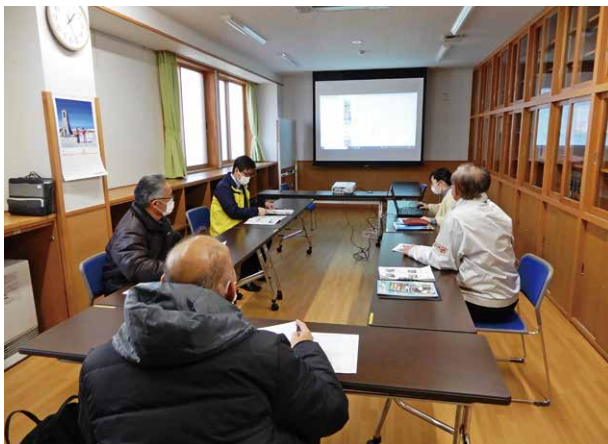
冊子検討チームの会議の様子

冊子検討チーム（8名－西部地区担当4名・塩尻地区担当4名）を作り、11/30、12/6、12/20、1/17、2/7 検討を重ねてきました。そして、ここに「西部地域魅力発見・みんなで作ろうデジタルマップ」を完成させました。（全戸配布）