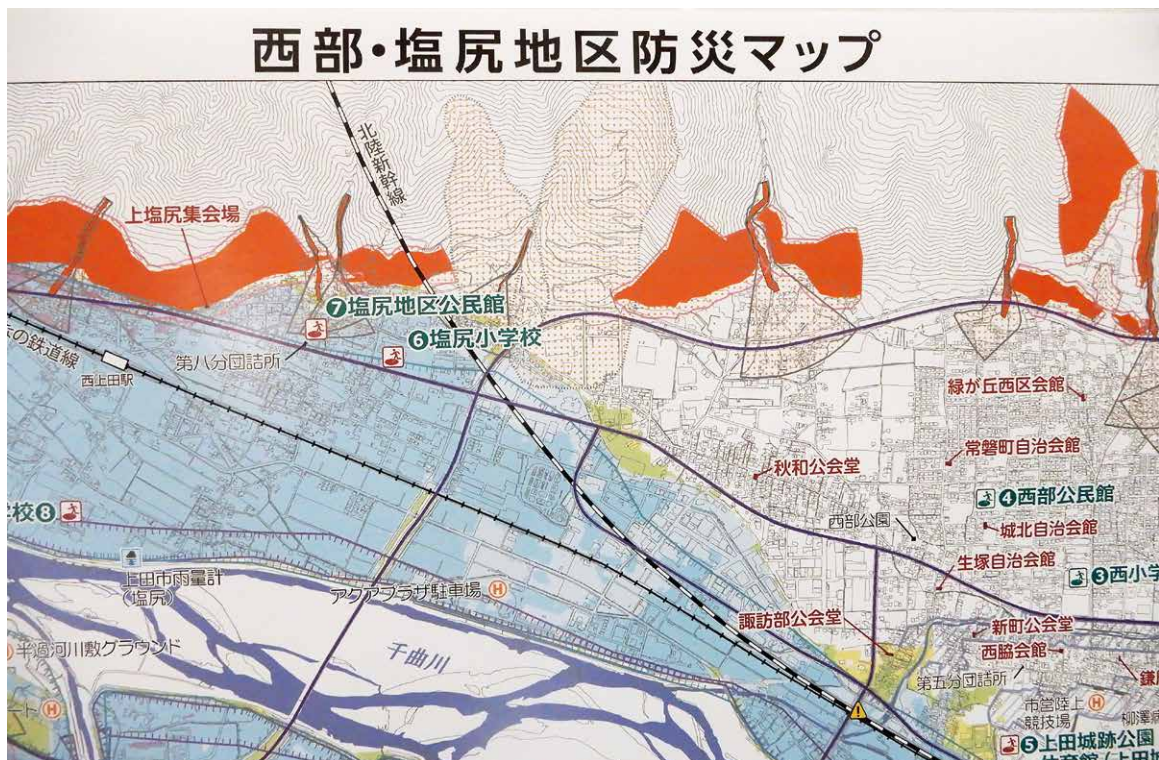
西部・塩尻地区防災マップ