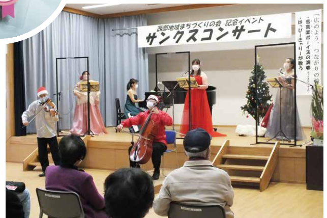
アンコールに応じて…一段と熱気を帯びて