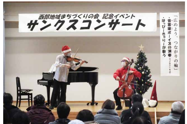
第1部…ボーイズの演奏とトークに魅せられて