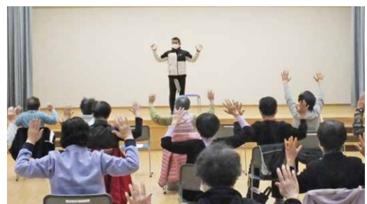
寝たきりにならない体操