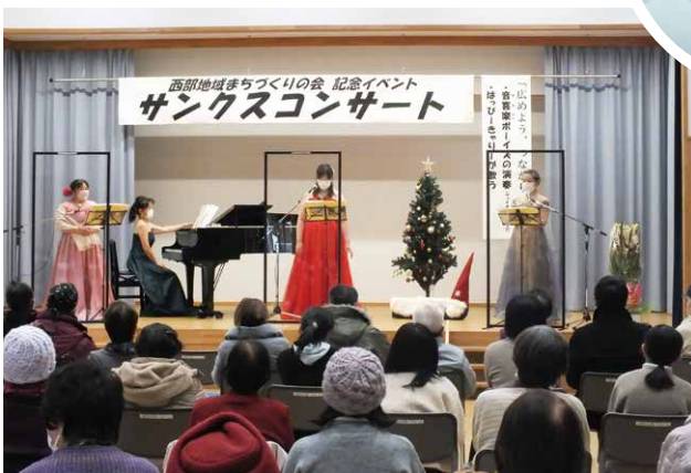
第2部…はっぴーきゃりーの歌声に酔いしれて