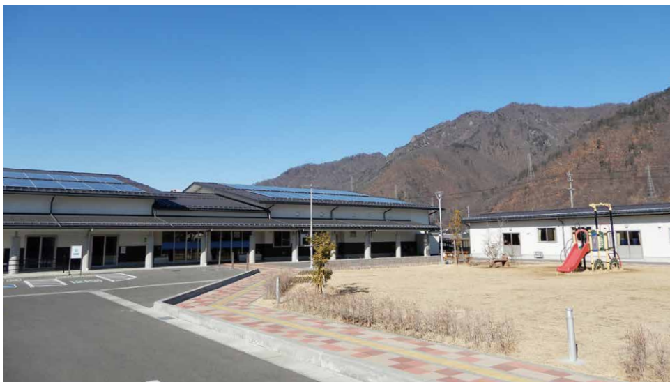
春を待つ、コロナの収束を待つ…、活動拠点の西部公民館

なお令和4年度のまちづくりの会のスタートは、4月21日(木)の総会を経て、本格的な活動は5月からになります。新メンバーを加えて地域課題解決に取り組んでいこうと思っています。