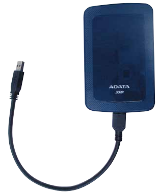
15自治会のマップが このメモリーに

コロナ禍の中で一堂に会した会議は持てず、メール通信等で部会員との意思の疎通をはかってきました。IT 担当者部会は防犯・防災部会の活動の中から、各自治会ごとの防災体制づくりの一部として「救助マップ」を作ることと、それを統合して利用することを目標に、PC 作業担当者を決めるところから出発しました。そして、このマップづくりを進める中で、このマップを「統合して利用する」ことの一一致点が見えず、会としての「救助マップづくり」は白紙に戻すことにしました。そこで、部会としての各種マップづくりは各自治会でということになり、新たな課題ができるまで、この部会は一旦休部にすることにしました。