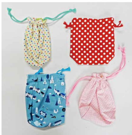
完成品…コップ入れ袋