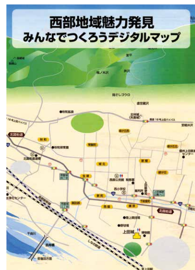
「みんなで作ろうデジタルマップ」冊子の表紙