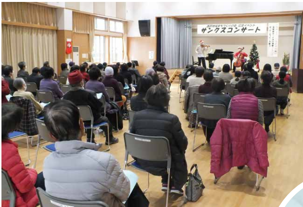
待ってました、今日のこの時を!