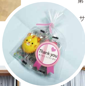
サンタさんありがとう 良かったよ